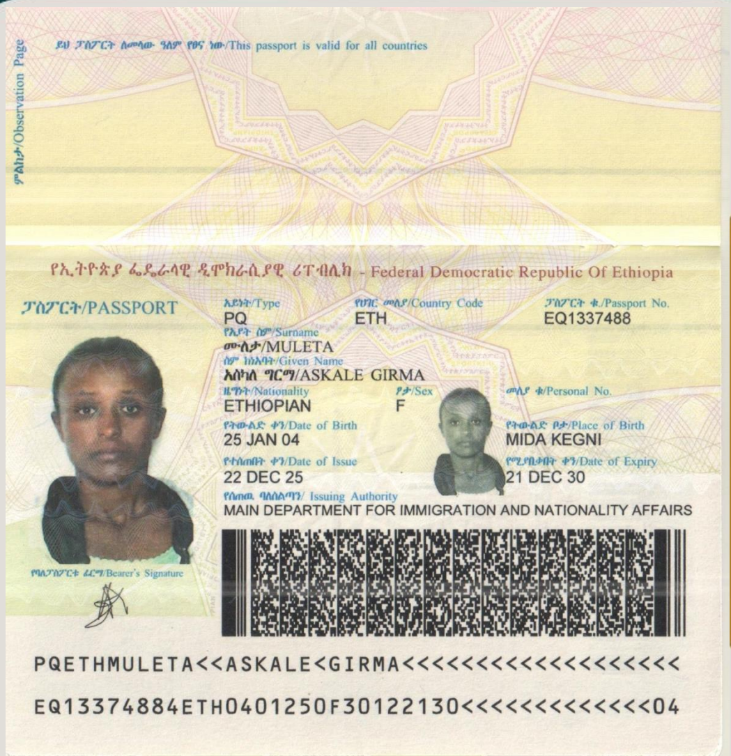
صورة جواز السفر